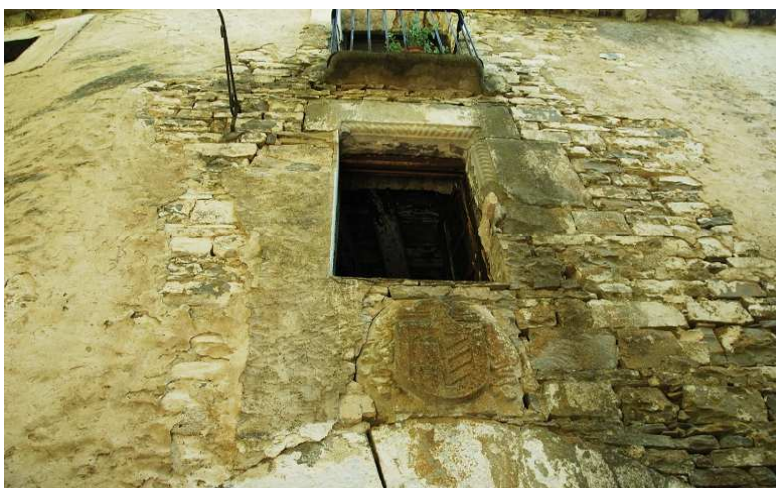
Izquierda. la parte más antigua de la casa. Derecha. escudo sobre portada y ventana moldurada.