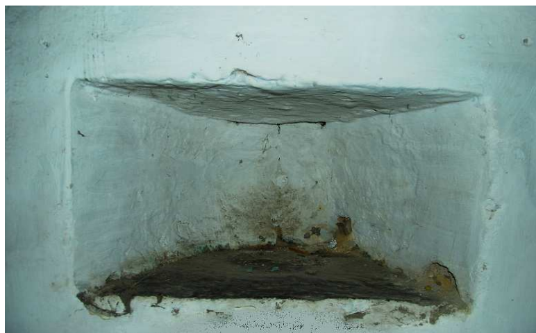
Izquierda: piso primero, a la izquierda de la ventana lo que parece una alacena, es realmente la aspillera. Derecha: aspillera defensiva conservada en la primera planta, obsérvese el orbe central.